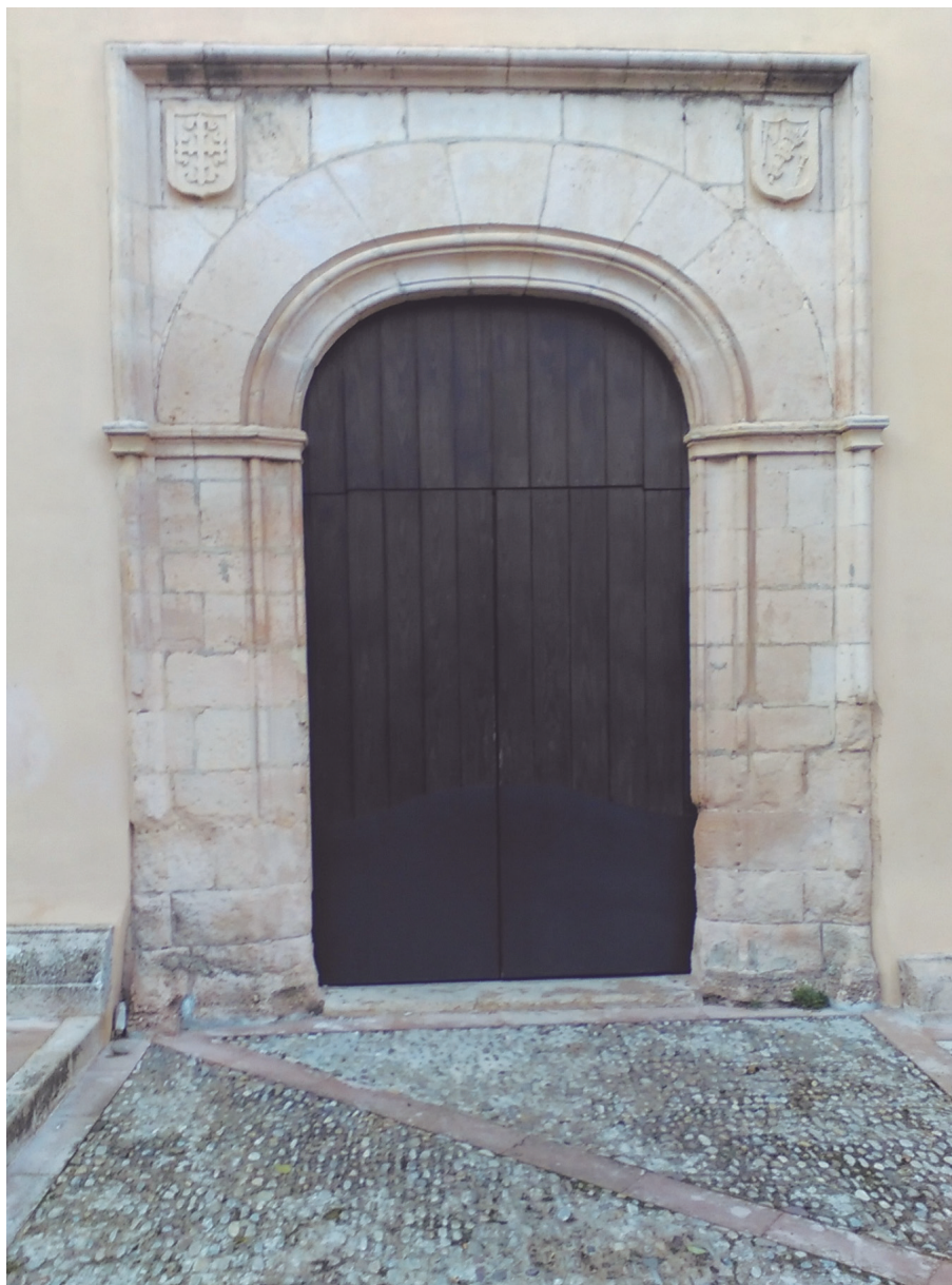
Foto 3. Puerta de la iglesia de San Pedro Mártir.