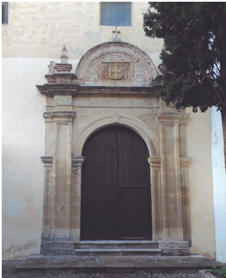
Foto 5. Portada de la iglesia de Madre de Dios.