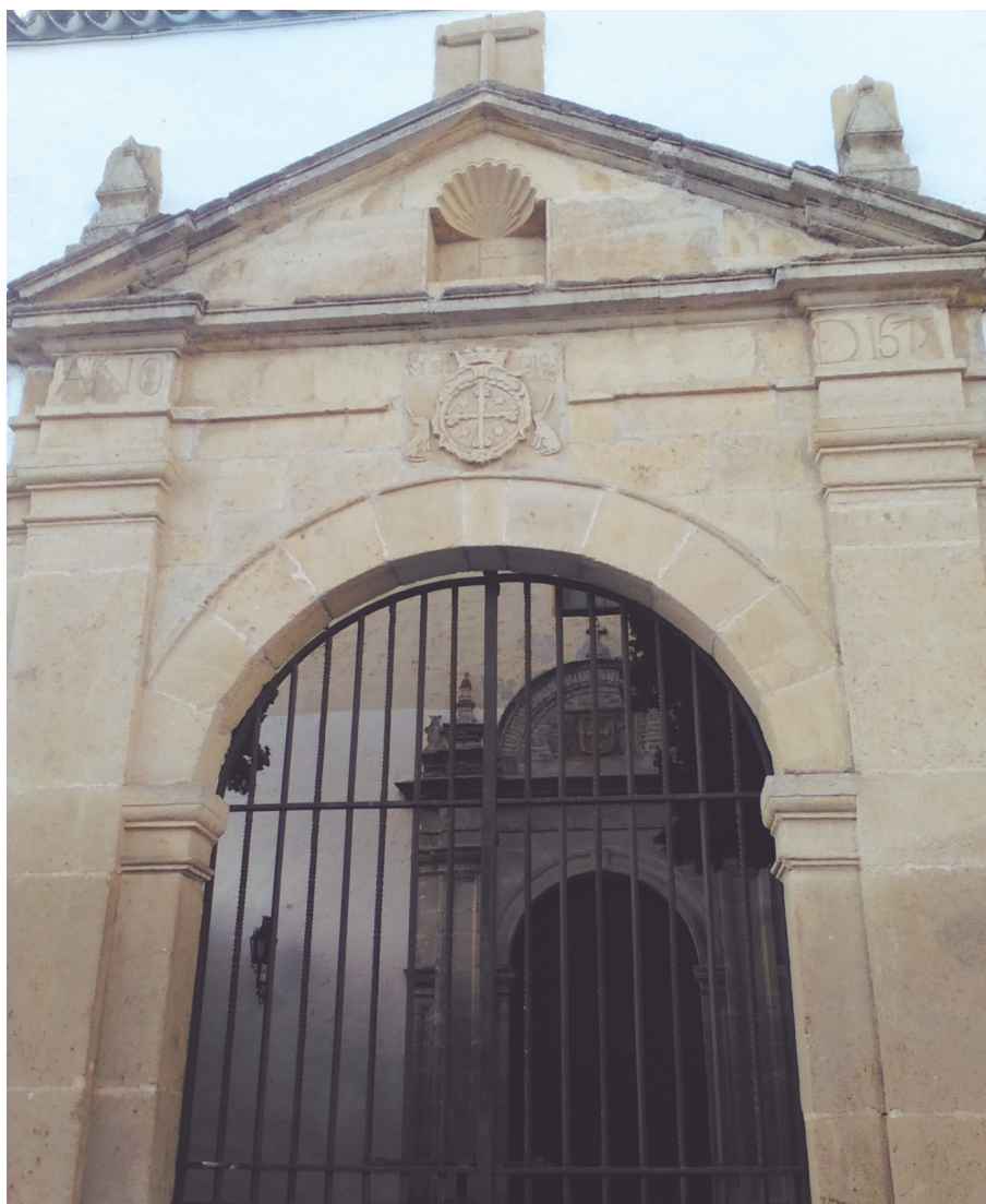
Foto 4. Atrio de la iglesia del convento Madre de Dios.